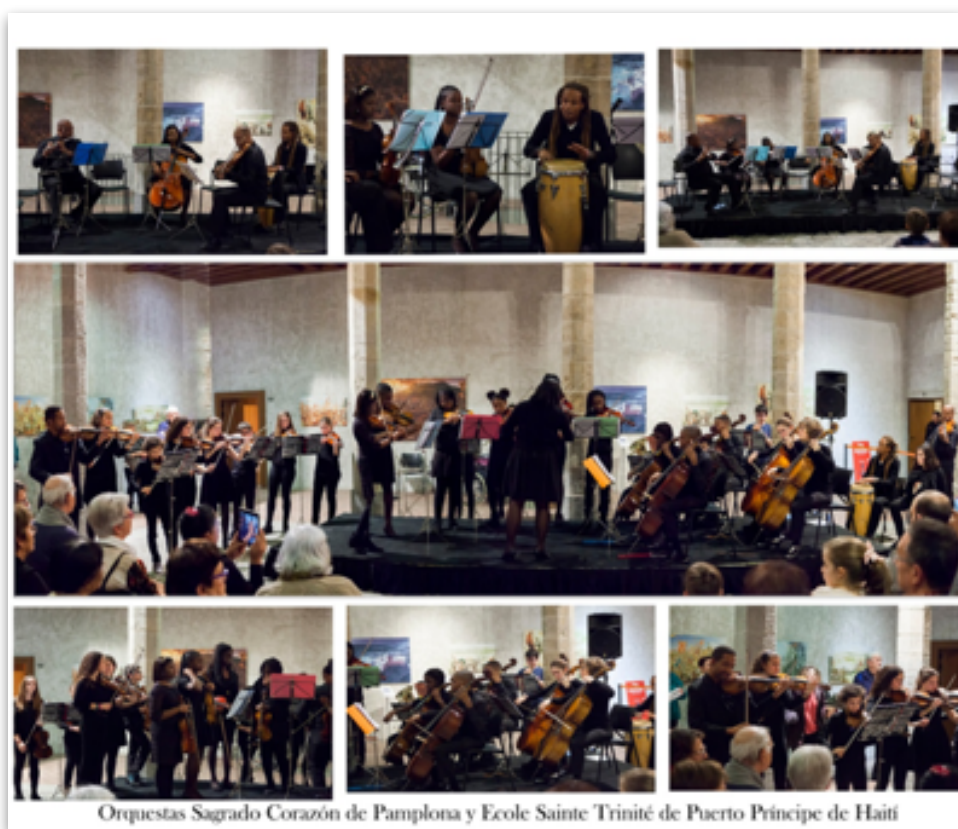
Orquestas Sagrado Corazón de Pamplona y Ecole Sainte Trinité de Puerto Príncipe de Haití

Este curso hemos comenzado de nuevo con la ilusión de aprender y también con el compromiso de ayudar. Por ello, el coro y la orquesta del Colegio han participado, en el mes de noviembre,